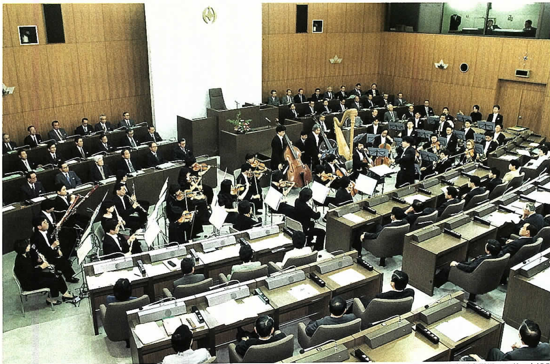
千葉市議会議場コンサート'99