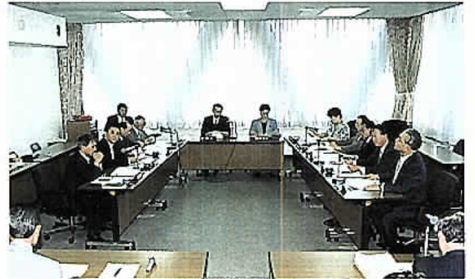
総務委員会審査風景

その結果、全議案を可決し、請願 は、採択送付1件、不採択1件、継 続審査3件となりました。