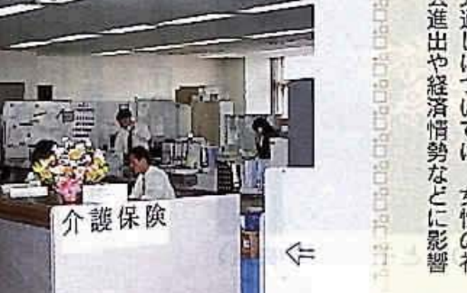
各区に設置された介護保険課(写真は稲毛区介護保険課)

介護保険制度では、1号被保険者の保険料は標準額で年間3万6千円、介護サービス利用料は1割を負担するが、支払に困難な市民には保険料と利用料の減免制度を、市独自で作ってほしい。 介護保険制度は、高齢者の生活を支えるための重要な制度。1号被保険者の保険料は標準額で年間3万6千円、介護サービス利用料は1割を負担する。