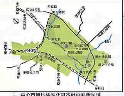
中心市街地活性化基本計画対象区域

中心市街地活性化基本計画をめぐり、今後、活性化の取り組みをどのように進めようかと考えているのか。また、新計画は、どのようにして進めようかと。また、新計画は、どのようにして進めようかと。また、新計画は、どのようにして進めようかと。 中心市街地活性化基本計画は、中心市街地の活性化を図るための基本となる。中心市街地活性化基本計画は、中心市街地の活性化を図るための基本となる。中心市街地活性化基本計画は、中心市街地の活性化を図るための基本となる。