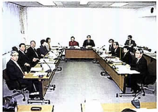
経済教育委員会審査風景

3月8日に開かれ、市長提出議案74件、議員提出議案1件、請願8件、陳情1件を審査しました。