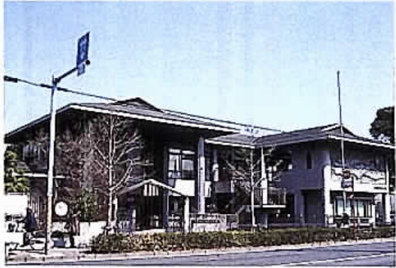
稲毛区内の公民館の中核となる小中台公民館

一般会計補正予算や千葉市公民館設置管理条例の一部改正など議案14件、請願1件を審査し、公民館設置管理条例の一部改正に賛成、公民館運営協議会を各区分1か所の中核的な公民館に統合する理由や各地区公民