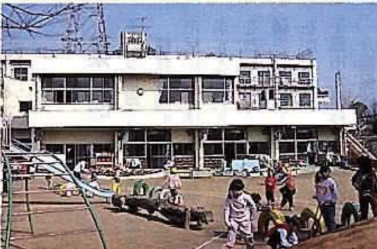
増築される桜木保育所

認証取得の関係予算が大幅に増額された背景と、取得に向けた今後の進め方の基本的な考え方について。認証取得の関係予算が大幅に増額された背景と、取得に向けた今後の進め方の基本的な考え方について。 ISO14001の認証取得は、環境管理の国際標準。認証取得の関係予算が大幅に増額された背景と、取得に向けた今後の進め方の基本的な考え方について。