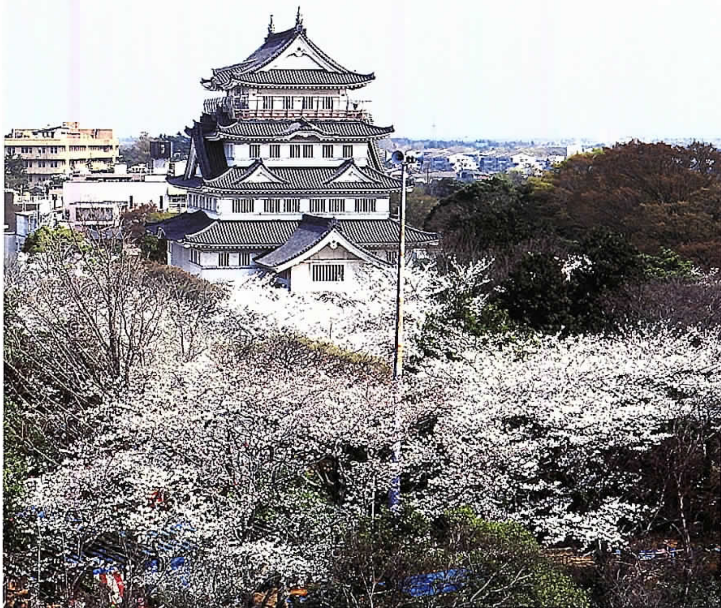
亥鼻公園の桜と千葉城(中央区)

平成12年第1回定例会が、2月21日から3月17日までの26日間の日程で開かれました。 この定例会では、平成12年度予算ならびに地方分権一括法および介護保険法の施行に伴う条例の制定や改正など市長提出議案99件を審議し、98件を原案どおり可決・承認・同意し、千葉市情報公開条例の全部改正議案については、原案に一部修正を加え、可決しました。 さらに、議員提出議案3件、意見書8件、決議3件、請願8件を審議したほか、各会派の代表質疑が7名の議員により行われました。 12年度予算案については、全議員で構成する予算審査特別委員会を設置し、審査しました。 また、市と区の選挙管理委員および同補充員の選挙を行いました。