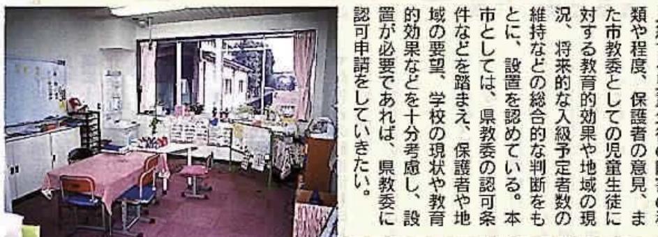
聴覚障害児学級の教室(院内小学校)

地域通貨の新しい試みについて。地域通貨の新しい試みについて。地域通貨の新しい試みについて。