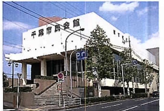
耐震補強等工事のため休館中の市民会館

一般会計補正予算や千葉市民会館設置管理条例の一部改正など議案6件を審査し、市民会館の耐震補強などの改修に関し、会議室などにおける耐震補強以外の改修内容、利用申し込みの再開時期などについて、質疑がありました。