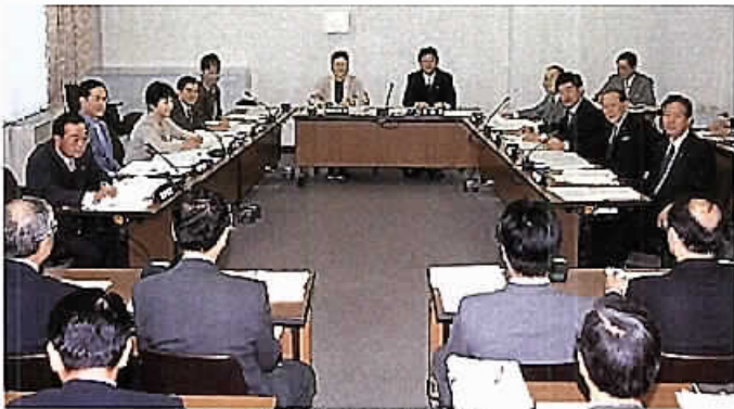
保健下水委員会審査風景

その結果、全議案を可決したほか、請願・陳情は、採択送付2件、不採択1件となりました。また、10月4日に経済教育委員会が開かれ、所管事務について調査しました。