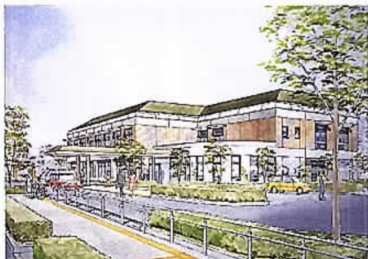
緑いきいきプラザ完成予想図

一般会計補正予算や緑いきいきプラザ新築工事請負契約など議案12件、請願1件、陳情1件を審査し、緑いきいきプラザの新築工事に関し、駐車場を増設する考え、建設用地の購入に至るまでの経緯と購入時における上下水道の布設状況などについて、質疑がありました。