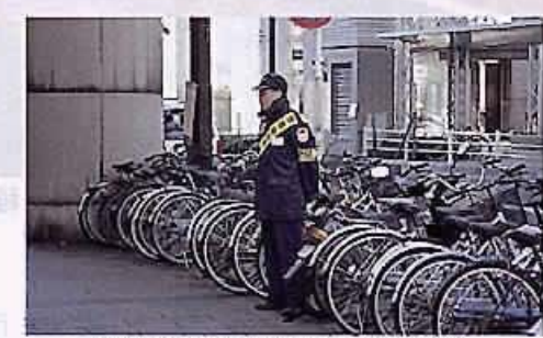
雇用対策事業(放置自転車回収指導)

Q 国の雇用対策として、緊急地域雇用創出特別交付金が創設され、本市の補正予算にも、この特別交付金が計上されたが、さらに、幅広い市民の情報リテラシー(情報活用する能力)の向上や読書教育の推進、子育て支援のための人材派遣など、市独自の施策の推進と重ね合うような事業を工夫し、雇用の創出を積極的に図るべきと考えるが、見解を伺う。 A 緊急地域雇用創出特別交付金の活用については、今定例会に補正予算として実施事業の一部を提案したが、引き続き、平成14年度から16年度までの事業を行うべく、現在、事業計画を策定しているところである。この策定に当たり、国から推