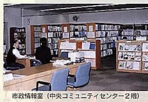
市政情報室 (中央コミュニティセンター2階)

Q 本市の情報公開制度は、平成12年に、市民に限られていた請求権を「何人も」に拡大するなどの全部改正を行ったが、閲覧手数料についても、市民サービスの向上という観点から、無料化を検討してもいい時期ではないかと考えるが、見解を伺う。 A 本市の閲覧手数料は、当時の情報公開制度運営審議会からの「費用の公平な負担を求めるとは妥当であり、できる限り利用しやすいものとすべき」との答申に基づき、平成12年10月から1件につき200円を100円に引き下げたが、他市の状況や情報公開制度が市民参加による公正で開かれた市政を推進する上で重要な制度であることなどを踏まえ、早急に情報公開審議会に相談し、適切に対処していきたいと考えている。