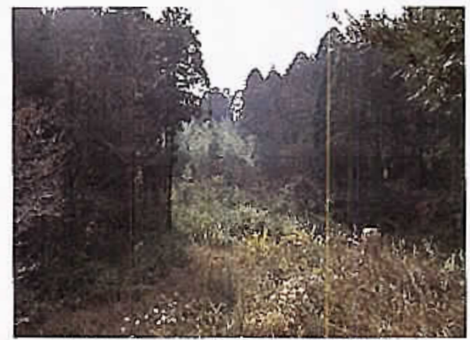
野呂調整池(仮称)建設予定地(若菜区野呂町)