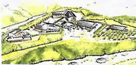
少年自然の家(仮称)完成予想図(長生郡長柄町)

一般会計補正予算と少年自然の家(仮称)外構整備工事請負契約の議案2件を審査し、少年自然の家(仮称)外構整備工事に関し、調整池の整備における谷津田の保全に向けた配慮の有無、長柄町との町道整備の協議状況などについて、質疑がありました。