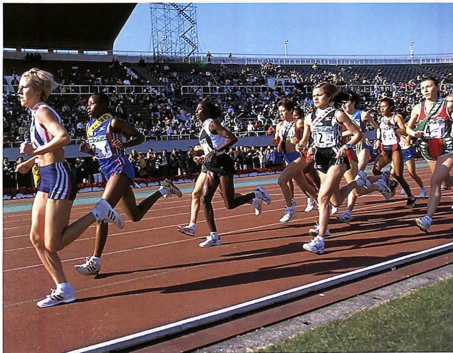
2001国際千葉駅伝(稲毛区・県総合運動場)

平成13年第4回定例会が、11月29日から12月14日までの16日間の日程で開かれました。この定例会では、補正予算ならびに条例の制定や一部改正など市長提出議案19件、議員提出議案2件を審議し、討論(賛成11市民自由クラブ、反対11日本共産党千葉市議員団)が行われ、市街地再開発事業特別会計補正予算など3件については、賛成多数により、その他の議案については、いずれも全会一致により、原案どおり可決・承認しました。また、千葉市ホームページラザ設置管理条例の一部改正の議員提出議案については、賛成少数により、否決しました。 さらに、意見書11件、請願1件を審議したほか、各会派の代表質問が7名の議員により、一般質問が9名の議員により行われました。