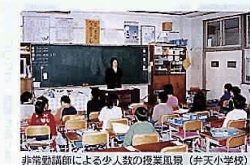
非常勤講師による少人数の授業風景 (升天小学校)

Q いじめ、学級崩壊、学力低下問題など、教育問題は深刻な事態となっている。埼玉県では、小中学校低学年の学級編制基準を来年度から38人学級にする方針を掲げ、志木市の25人学級にも同意したとのことである。本市は、今年度1学級36人以上の1年生の小中学校に非常勤講師を配置したが、36人以上のクラス数、学級数はどれくらいで、これらの全ての学級で実施した場合の予算はいくらか。また、実施することを求めるが、どうか。 A 小学校の36人以上のクラス数、学級数は、延べ257学級である。これらの学級に非常勤講師を派遣した場合の予算は、122名で約二億九千万円である。来年度については、7次定数改善計画の進捗状況や県教委の少人数指導の取り組みの動向を見極めながら、考えていきたい。