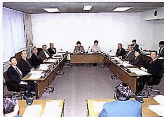
経済教育委員会審査風景

その結果、すべての市長提出議案は可決となり、議員提出議案の千葉市ホームページラザ設置管理条例の一部改正については否決となりました。