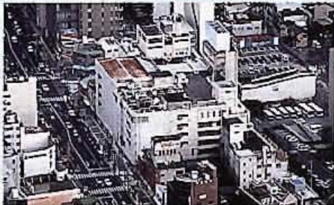
中央第六地区再整備事業予定地付近(中央区中央4丁目)

Q 旧扇屋ジャスコ跡地を中心とした中央第六地区再整備事業は、都市の再生を目指した先進的なプロジェクトとして期待されている。このプロジェクトのコンセプトと整備が予定されている「子ども科学館」「児童センター」「子育て支援プラザ」「産業振興会館」など、各公共施設の施設概要について伺う。 A 今後の事業スケジュールについて伺う。 また、今後の事業スケジュールについて伺う。