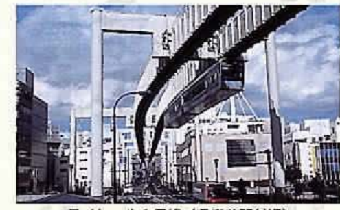
モノレール1号線(県庁前駅付近)

Q 公共事業改革が国のあけて議論されている中、千葉都市モノレールの延伸問題について、主体事業者である県が事業の見直しを断り、専門家が参加する新たな協議機関を設けて話し合うことと県と市が合意したことだが、市が主体事業者となった場合、費用負担はどのようなものか。 A 県庁前駅以遠の延伸事業については、これまで県が主体として施工しようとしていたと考えており、市が事業主体となる場合は、費用負担はどのようなものか、見解を伺う。 A 県庁前駅以遠の延伸事業については、これまで県が主体として施工しようとしていたと考えており、市が事業主体となる場合は、費用負担はどのようなものか、見解を伺う。