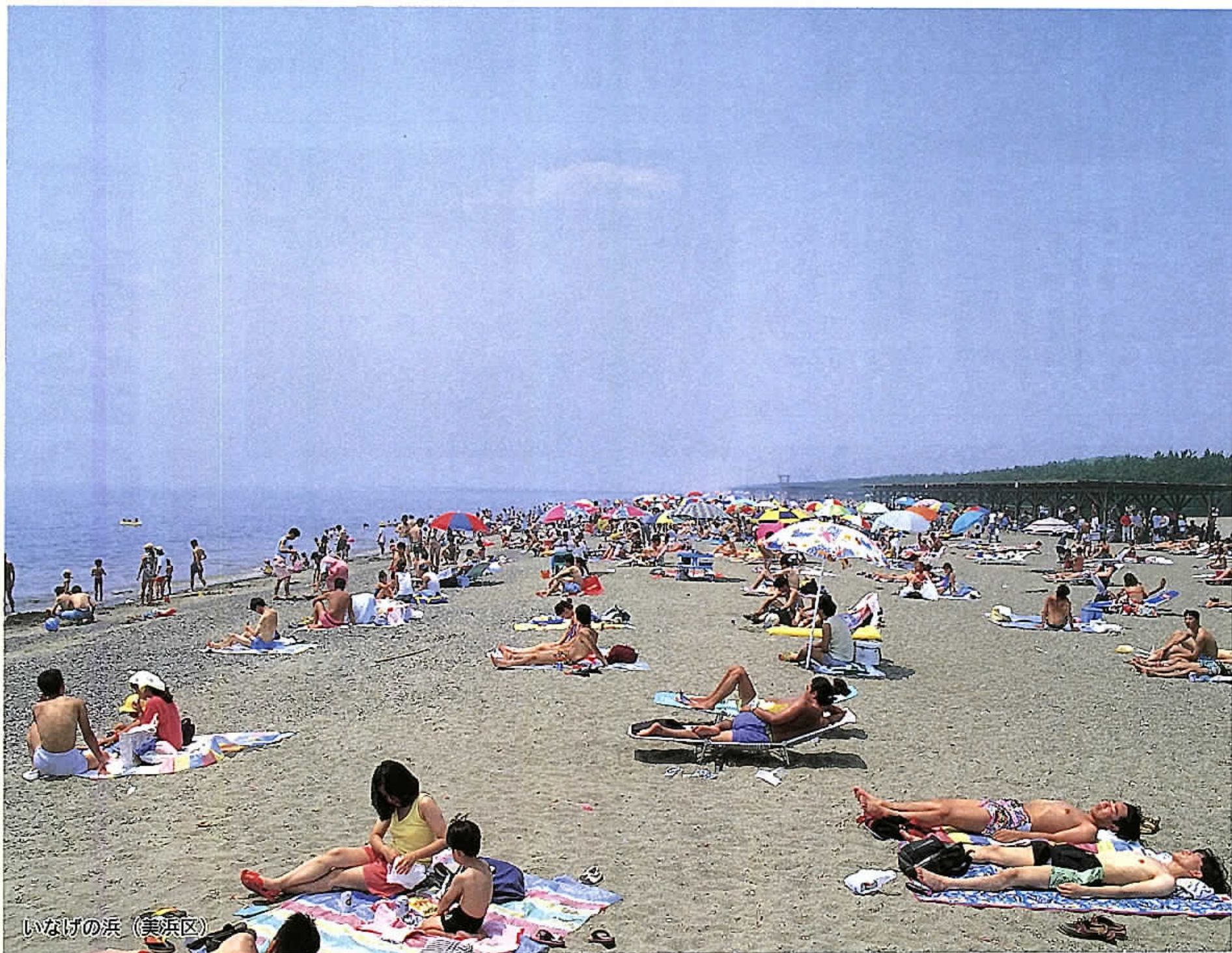
いなげの浜 (美浜区)