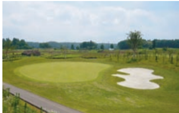
10月23日オープン予定の千葉市民ゴルフ場(若葉区下田町)

議案3件を審査し、市民ゴルフ場の指定管理者について、選定委員会再審査で、内部委員と外部委員の評価得点の乖離についての見解、客観的な判断ができる新たな選定委員による再審査の必要性。指定管理予定候補者が収入の妥当性の項目で高評価を得た理由および根拠のないPGAの全面的支援などをうたった提案書を提出したことへの見解。業務遂行能力の評価と確認方法、収入が提案を大幅に下回った場合のペナルティの有無などについて質疑がありました。