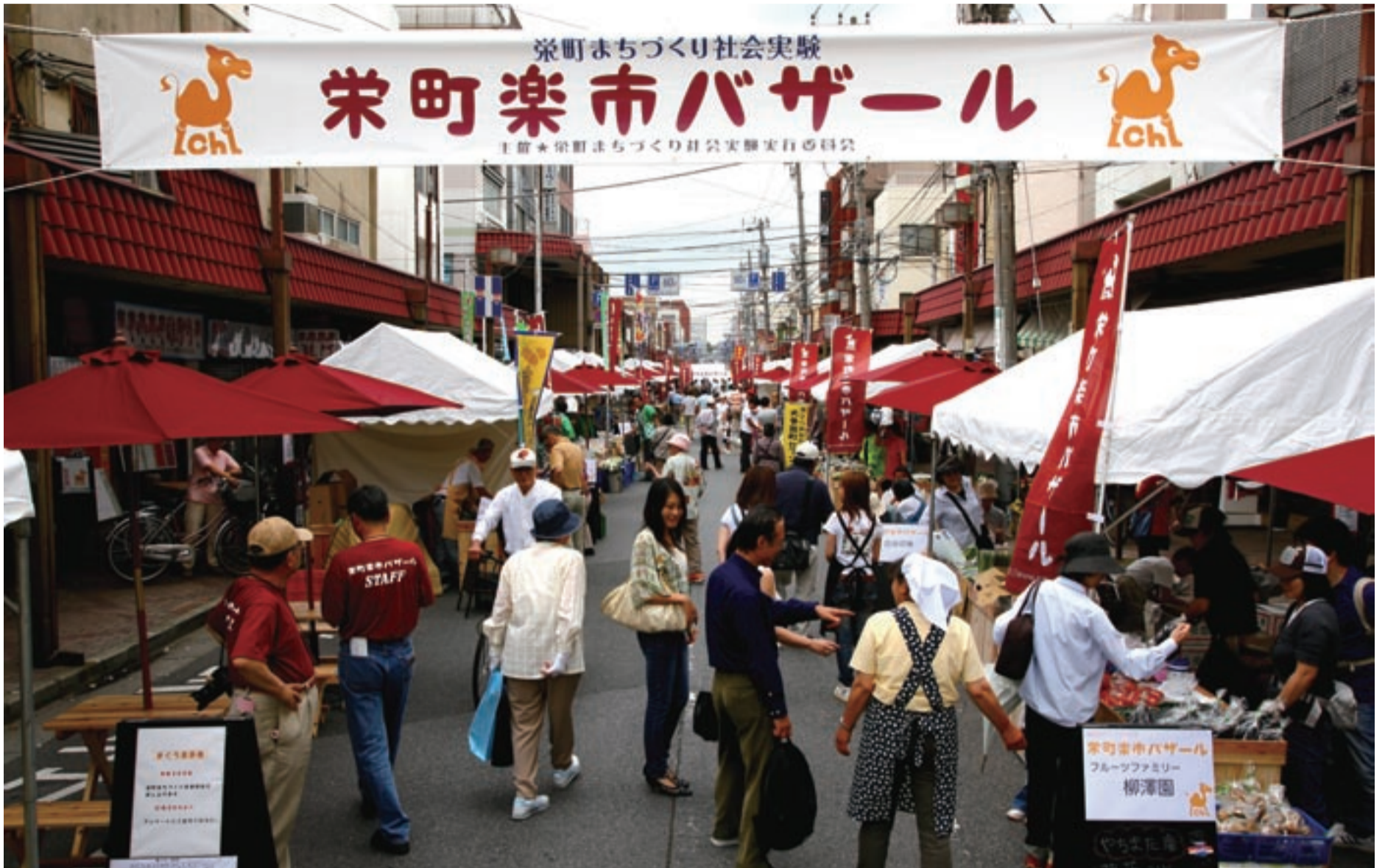
栄町楽市バザール（栄町まちづくり社会実験）