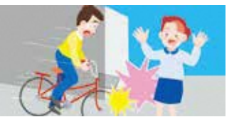
自転車事故で多額の賠償を命じる判決も出ている

答 保険加入については、市政だよりをはじめ加入を促すチラシを配るなどして周知を図る。また、保険加入の義務化を周知する中で、安全運転の啓発も併せて行う。