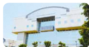
多様化する市民ニーズに対し質の高いサービス提供が進められている(写真は蘇我コミュニティセンター)

答 施設の開館時間の拡大、Wi-Fi環境の整備、自主事業の実施などによりサービス向上が図られている。一方で、施設により指定管理者が異なるケースがあり、市からの指導や依頼が正確に伝わらない事例があるため、定期的に確認していく必要がある。