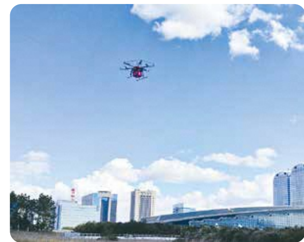
国家戦略特区では、ドローン宅配などの近未来技術実証実験を行っている