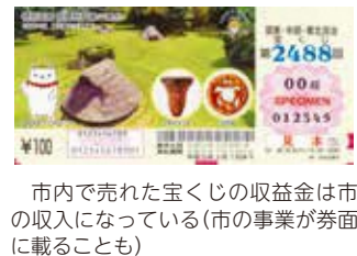
市内で売れた宝くじの収益金は市の収入になっている(市の事業が券面に載ることも)

答 本市における令和元年度の宝くじの収益金は約26億円となっている。その使い道については、公共事業のほか、国際化推進事業、芸術・文化振興事業などの公益の増進を目的とする12事業が地方財政法及び省令で定められており、本市では、令和元年度は敬老事業、少年自然の家や美術館の管理運営事業などのほか、オリパラ事業に活用している。