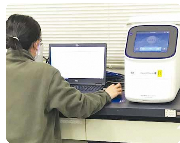
専門の機器を使ってPCR検査を行っている