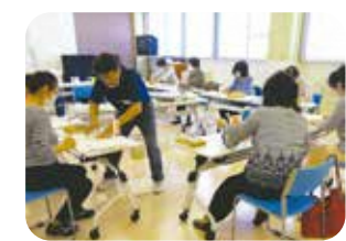
ボランティアセンターと連携して公民館主催講座を開催している

答 ちば生涯学習ボランティアセンターから公民館主催講座などへの講師派遣のほか、学習相談やメディア学習の機能を活用した公民館職員向け研修を実施している。公民館における学習相談件数が大幅に増加しており、研修の積み重ねが市民サービスの向上に繋がったと考えている。