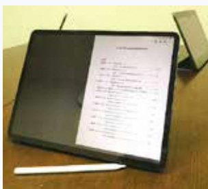
議員持参のタブレット等を使って議案研究を行った

議会開会日に議案が提案されると、「議案研究」と呼ばれる会派ごとの勉強会が行われます。期間は議案の量により異なりますが、最長4日間にわたります。議案研究では、局(総務局、財政局など)ごとに職員が議案を説明し、議員は質疑をして議案への理解を深め、その後の審査の準備をします。