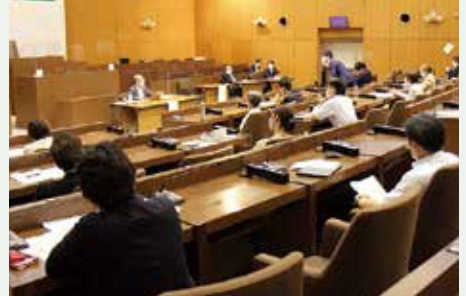
学識経験者によるキックオフ講演会