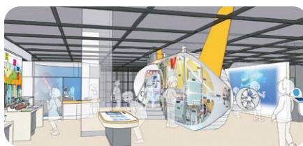
リニューアル後の展示イメージ

答 開館から14年が経過し、現在の展示物に老朽化および陳腐化が見られるため、「最新の科学をより魅力的に、さらにわかりやすく」をコンセプトに、身近な科学である宇宙・海底・地底に焦点を絞り、新規展示品(しんかい6500実物大レプリカ、素粒子コーナー等)を導入する。なお、休館することなく展示品の入れ替え等を進め、令和4年9月のリニューアル完了を予定している。