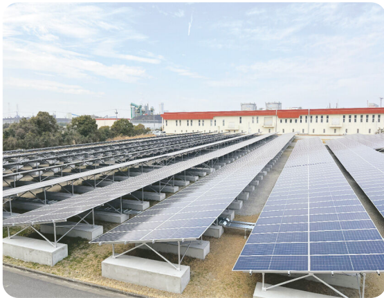
南部浄化センターの太陽光発電設備

答 市有施設や市内農地への太陽光発電設備導入や清掃工場の余剰電力の活用などにより、令和8年度から市有施設の電力消費に伴うCO2排出実質ゼロを達成する見込みとなった。現在、南部浄化センターへの大規模な太陽光発電設備導入や、市有施設の電力需給を一元管理するシステムの構築などが着実に具現化されており、この進捗に対し、国の中間評価において優良事例として評価された。今後も事業を着実に進めるとともに、他自治体への横展開などにより、地域脱炭素に貢献していく。