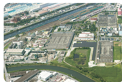
南部浄化センター

答 企業債の償還額の高止まりや、本市北西部の汚水処理を担う県への負担金引き上げのほか、維持管理に係る人件費上昇などにより、使用料算定期間である令和8～9年度に資金不足が生じるため、改定する。改定を行わない場合、適正な保守管理や計画的な施設の更新ができなくなることで、管路の老朽化が加速的に進み、市民生活や社会活動を下支えする安全で安心な下水道事業の安定的な提供に影響が出るおそれがある。