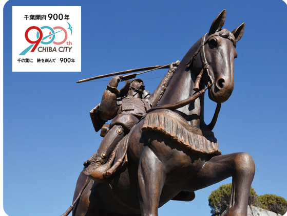
千葉開府900年 CHIBA CITY 1700年 開府 900年

答 開府記念事業は、時代背景や社会状況の変化を踏まえ、本市が持つ課題や将来像を市民と共有し、次の時代へつなぐ節目としての役割を担ってきた。開府900年は、直面する人口減少や少子高齢化、価値観の多様化などが進む中、先人たちが築いてきたまちと歴史・文化を継承し、ひと・まちづくりに係る本市の将来を形作る取り組みの場となる。「ひとづくり」では、高校生や起業家の研修プログラムやデジタル人材育成プログラムなど、次代を担う人材育成を、「まちづくり」では、中央公園プロムナード再編や千葉マリスタジアム再構築、市民会館再整備など、都市基盤の整備を推進する。