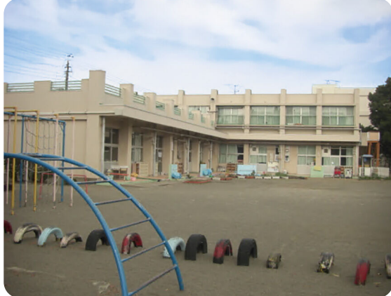
建て替え予定の公立保育所

答 これまで、幕張新都心で実証実験を行い知見の蓄積を図ってきた。得られた成果や課題を踏まえ、将来的な幕張新都心をはじめとする市内への展開を見据えながら、地域のバス事業者などと連携のうえ、早期に社会実装が見込まれるJR土気駅から大椎町南までの既存バスルートで、実証に取り組むこととした。今後は、この検証結果を踏まえ、令和9年度中の社会実装を目指していく。