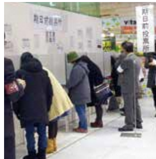
イオンマリンピア店に設置された期日前投票所