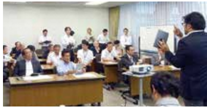
タブレットを使った文書共有システムの体験会を実施

議会内部事務の効率化や議会活動の向上のため、タブレット型端末を活用した文書共有システムの導入を今後進めていくこととした。