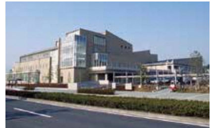
男女共同参画センターがある千葉市ハーモニープラザ

答 センターでは、地域における男女共同参画の視点に立った組織や団体とのネットワークの構築を充実させていく。今年度から新たに、男女共同参画推進事業者として登録した事業所で働く女性を対象に、「民間企業で活躍する女性のロールモデルの提供」、新たに仕事を始めたい女性のための起業準備講座に加え「具体的な起業に向けての個別相談会」を予定している。今後も、地域における女性の活躍推進の核となる人材の発掘や確保及び育成等を行うほか企業の意識啓発、若年層を対象としたキャリア教育等を充実していく。