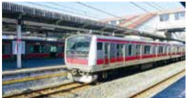
蘇我駅 京葉線ホーム

問 少子高齢化の進展や東京五輪の開催決定など、首都圏における鉄道ネットワークを取り巻く環境は大きく変化しており、本市も、鉄道輸送強化・改善を関係者に強く働きかけるべきだと考える。通勤者からの要望も多い京葉線・りんかい線の相互直通運転の実現への取り組み状況は。