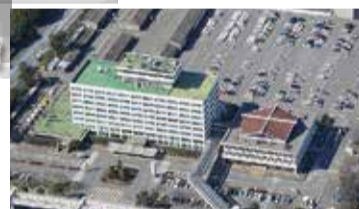
新庁舎建設の計画が進む市役所本庁舎

問 新庁舎建設については、財政的な展望を市民に説明も情報公開も果たしていない。パブリックコメントでの圧倒的多数の意見は「今急ぐべきではない、耐震補強で対応すべき」「建設はオリンピック後に」である。建設費、維持管理費で530億円以上もかかることは市民にほとんど知らされていない。市民の声を真摯に受け止め、財政が厳しい中、災害時に市役所業務ができるよう、耐震補強にとどめ、財政支出を抑えて、市民・職員の命を守るべきだが見解は。