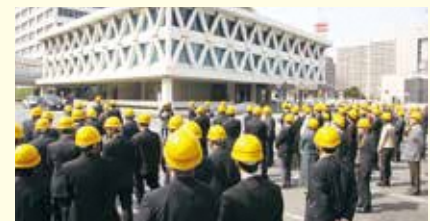
本会議時に大地震を想定した避難訓練を実施

災害はいつ発生するかわからない。この指針の策定は「待ったなし」ということで、早急に協議を進めた。