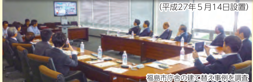
福島市庁舎の建て替え事例を調査

市庁舎建設にあたり、新庁舎に求められる機能とあり方や、庁舎と敷地の一体的な有効活用等について調査しています。