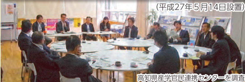
高知県産学官民連携センターを調査

大都市の実態に対応した行財政制度の確立と地方分権の推進や、地方創生について調査しています。