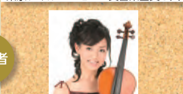
第7回千葉市芸術文化新人賞 (平成20年度受賞)