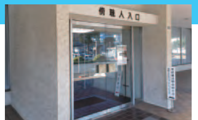
議会棟は市役所本庁舎の隣(国道側)です。受付は、議会棟1階の傍聴受付カウンターで行います。