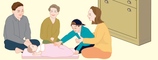
家具転倒防止金具の取り付け推進を

学校施設については、国から通知された「熊本地震の被害を踏まえた学校施設の整備について」の緊急提言を踏まえ、防災部門と教育委員会の連携を図りながら安全確保に努めていく。