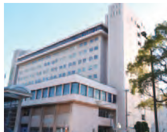
千葉中央コミュニティセンター

答 取得することにより、土地・建物の将来的なあり方の検討を、市が主体的かつ柔軟に進められるようになる。また、民間テナントからの賃料収入等により年間約3.1億円の収支改善が図られ、取得費の10億円を4年間で回収できる見込みである。施設の今後については、平成29年秋に決定予定の新庁舎整備の事業方針を踏まえ、検討していく。