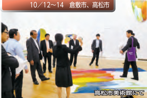
高松市美術館にて