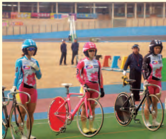
千葉競輪場でのガールズスケイリンの様子

イルの競輪を行う提案があった。この提案では、新規ファン開拓による車券売上の向上などが図られるとともに、施設の大規模修繕費用捻出の問題も解消されるものとなっている。今後の選択肢の一つとして、実現に向けた課題はあるが、検討作業に着手したところである。