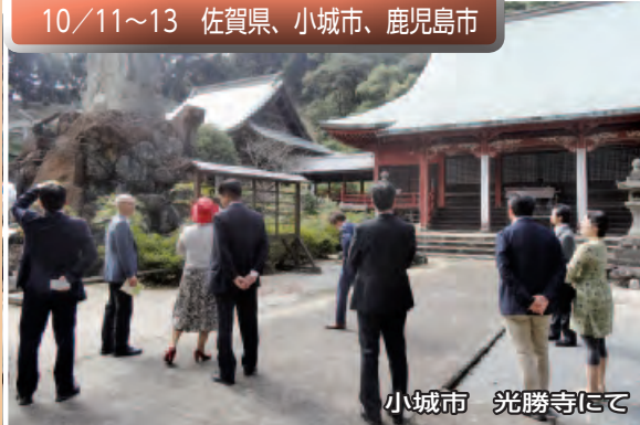
小城市 光勝寺にて