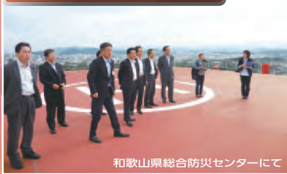
和歌山県総合防災センターにて