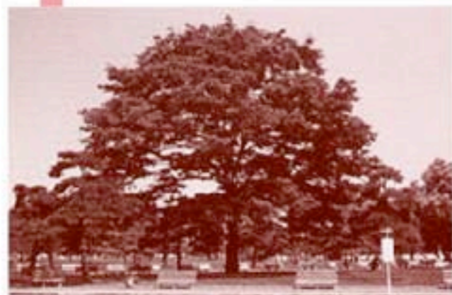
千葉市の木：けやき