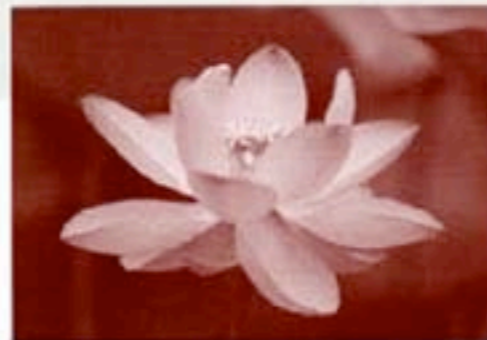
千葉市の花：大賀ハス