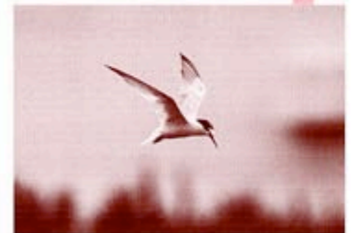
千葉市の鳥：コアジサシ