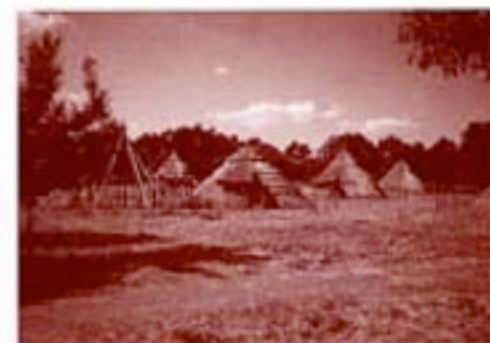
千葉市を代表する史跡：加曾利貝塚