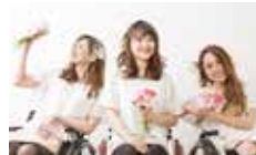
司 会 BEYOND GIRLS

千葉市の5つのビーチの魅力を発信する 5BEACH観光PR大使「幕張の浜」担当。