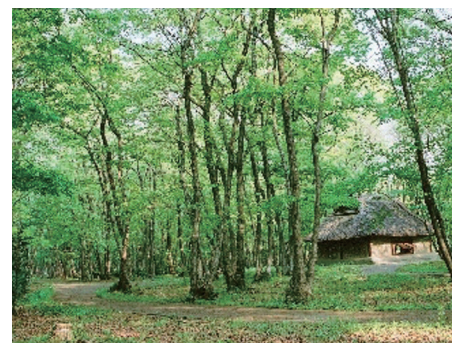
堀や土塁、建物などが復元・整備されています。