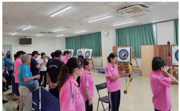
パラアーチェリー