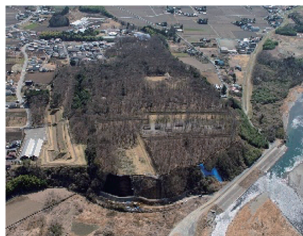
鬼怒川左岸に位置する飛山城史跡公園