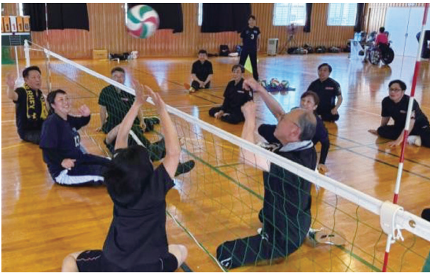
シッティングバレーボール