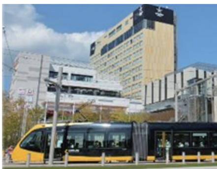
会場まではLRT（次世代型路面電車）をご利用ください。

令和5年8月に国内初の全線新設のLRT（次世代型路面電車）として開業した、ライトラインの旅も楽しめる。