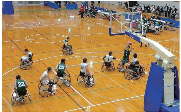
車いすバスケットボール