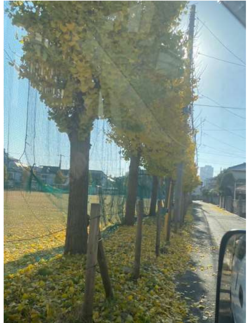
写真は令和5年12月7日時点