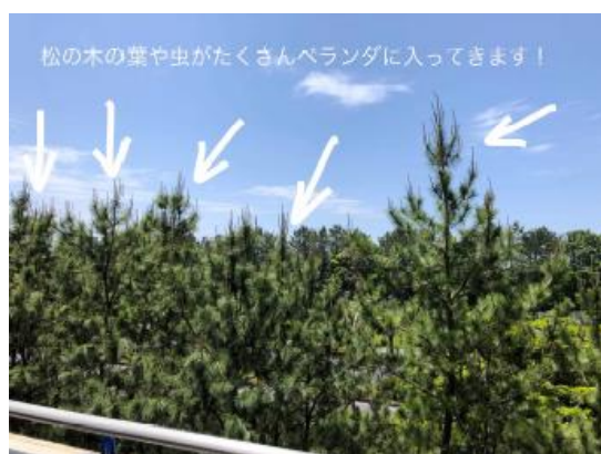
写真2 防風林の状況2