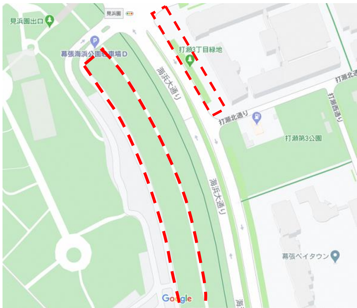
地図 点線が剪定対象（2 か所）