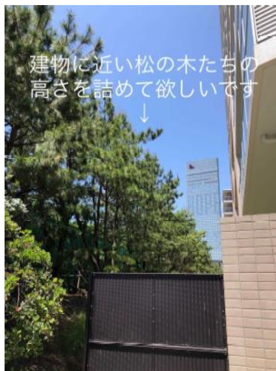
写真3 防風林の状況3