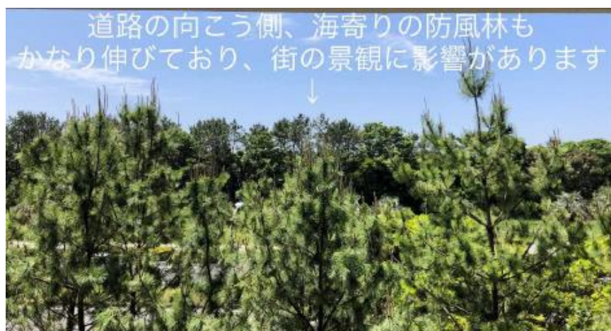
写真1 防風林の状況1