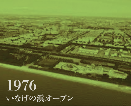
1976 いなげの浜オープン