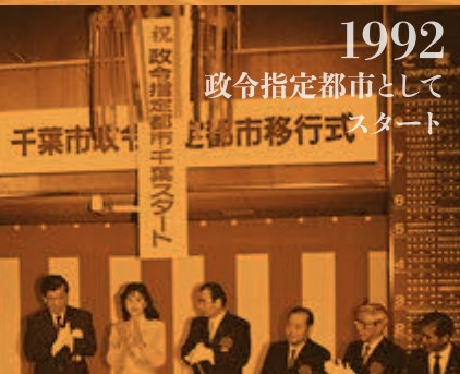
1992 政令指定都市として 千葉市改称と都市移行式スタート