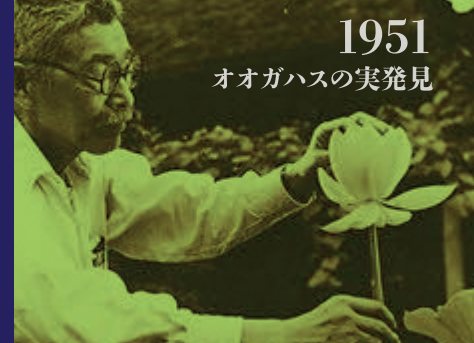
1951 オオガハスの実発見