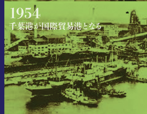
1954 千葉港が国際貿易港となる