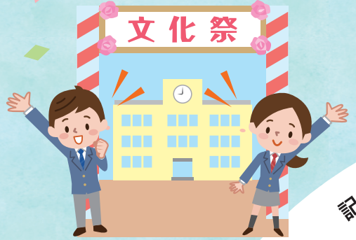
オープンキャンパス、 文化祭