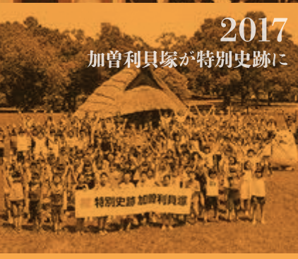
2017 加曾利貝塚が特別史跡に