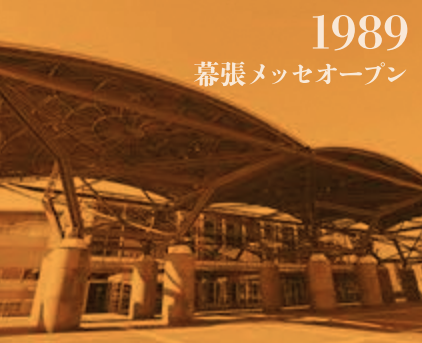
1989 幕張メッセオープン