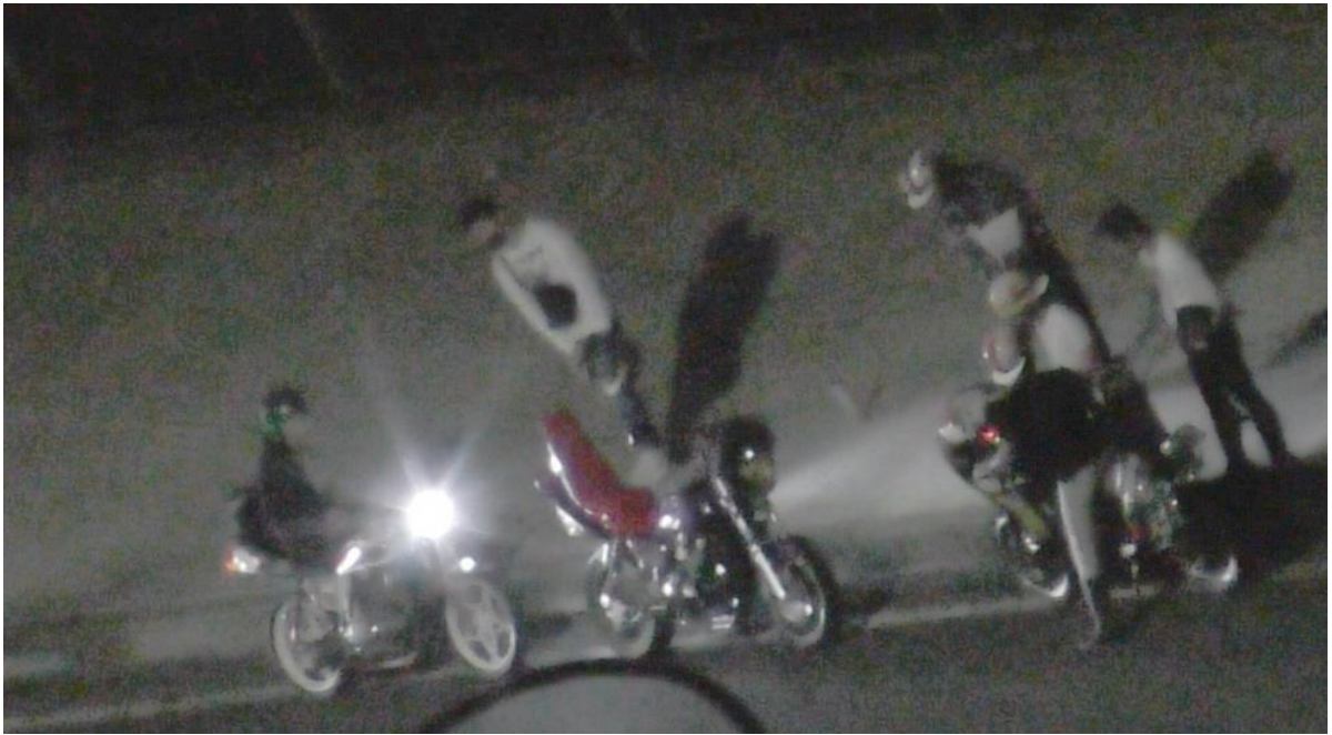
↑写真3 海浜大通りの幕張の海に集まる珍走団（暴走族）