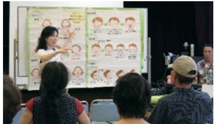
▲運動、口腔ケアなど介護予防の講座、講演会を多数開催

また、いきいきセンターは、市内9か所に設置され、60歳以上の方が健康で明るく生きがいを高めることを目的とし、各種の相談、健康増進、教育の向上及びレクリエーションを行っています。