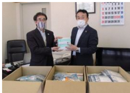
▲千葉県生活協同組合連合会様(右)マスクをいただきました。地域活動で使用させていただきます。

(株)セブン-イレブン・ジャパン、(株)シェルガーデン、(株)イトーヨーカ堂、(株)そごう・西武、(株)ヨークベニマル、(株)赤ちゃん本舗、(株)ヨーク、(株)ダイイチ、(株)アインファーマシーズ、(株)天満屋ストア (株)マルハン 千葉北店 在日本朝鮮千葉県千葉地域商工会 (福)生活クラブ風の村 千葉経済大学附属高等学校 千葉県生活協同組合連合会、生活協同組合 コープみらい、生活クラブ生活協同組合 ディアフレンズ美浜後援会