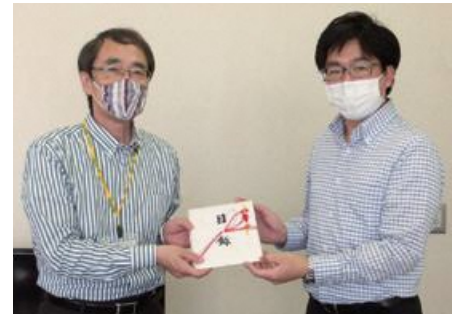
▲(株)ヤマノホールディングス様(右)