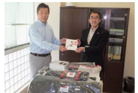
▲在日本朝鮮千葉県千葉地域商工会様(左)高齢者疑似体験セットをいただきました。福祉教育等に活用させていただきます。