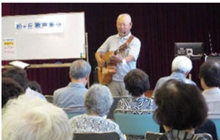
▲皆さんで歌う歌声集會や日本史を学ぶ講演会を定期的に開催