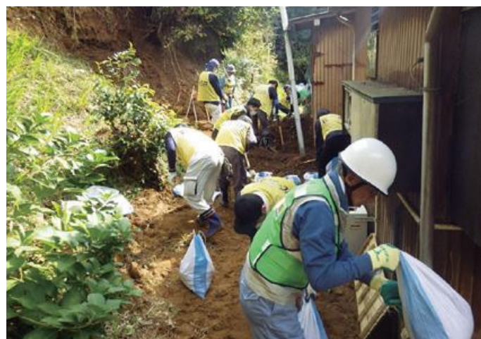
▲昨年の10月25日の大雨による豪雨災害時の、災害ボランティア活動の様子

被災地の情報は、被災地の市役所や役場、災害ボランティアセンターのSNS等で確認できます。