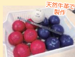
手作りボッチャボールを福祉施設や学校へ寄贈

これからもボール作りを続けていきたいのですが、個人之力では限界があるので、アイデアや情報交換をして一緒に製作できる仲間を募っています!