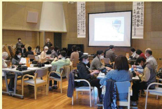
これから『VR認知症体験会』が始まります

このVR体験を基に認知症の方とその家族に対し私たちは何ができるのか、お互いを理解し尊重することの大切さについて改めて考える機会となり、「誰が認知症になっても大丈夫、みんなで支え合うから。」という思いを胸に参加者全員が今後の活動に活かしていきたいと感じていました。