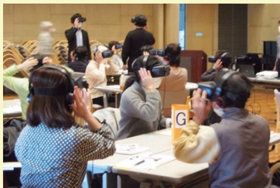
「ゴーグルから見えた情景は本物のようでした」 「認知症の方はこのような日々を送っているのかと衝撃」

このVR認知症体験会の実施にあたり、「地域ふくし力アップ助成金」を活用し、社協美浜区事務所CSWへ相談・情報