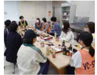
本会若手職員と学生による交流会の様子