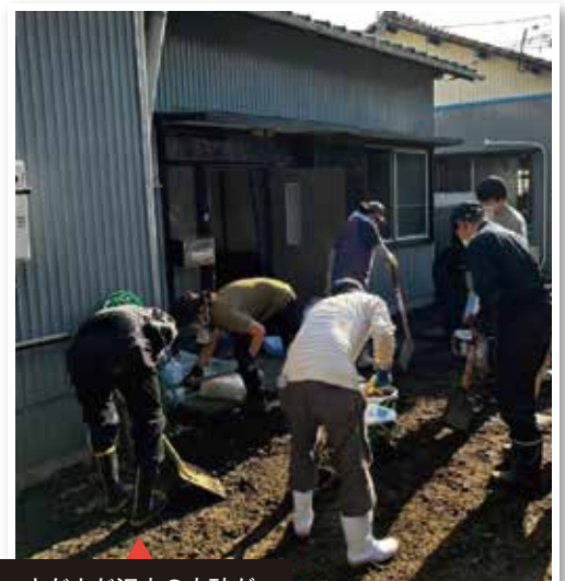
まだまだ沢山の土砂が

今後、災害ボランティアセンターのICT化により、より円滑で効率的な運営となることが期待されています。