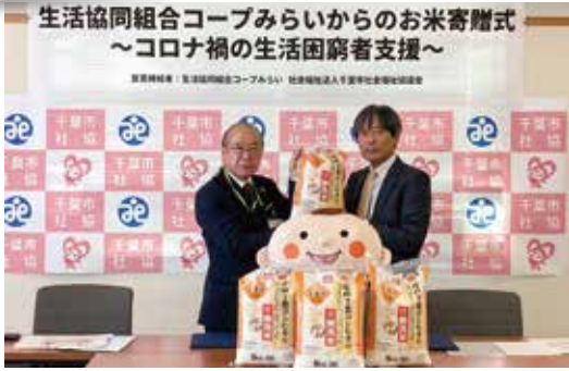
コープみらい永井副理事長(左) 本会初芝会長(右)

11月22日(火)、生活協同組合コープみらい様と本会は、「食品等の寄贈に関する覚書」を締結しました。