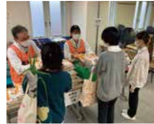
フードパントリーでのお米の提供の様子

当日は、約150人の学生が訪れ、フードパントリーのほか学生同士の交流や看護師による健康相談に参加しました。