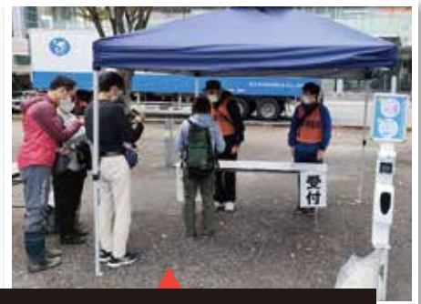
前日までに事前受付を済ませ当日受付はQRコードをスマホで「ピッ」と読み取り氏名等を登録

台風15号の豪雨により、静岡県内の市町村が広範囲に多数の人的・物的な被害を受けたため、『関東甲信越静岡ブロック都県指定都市社会福祉協議会(1都10県8市)災害時の相互支援に関する協定』による静岡県社協からの要請に基づき本会から職員を派遣しました。