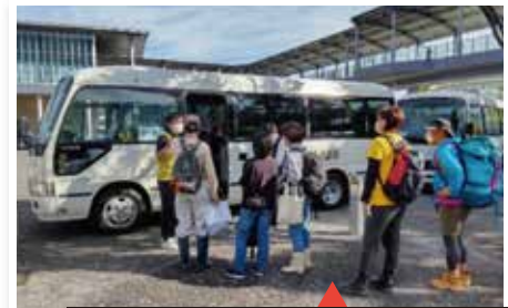
清水駅前広場から災害ボランティアセンターまでバスで送迎