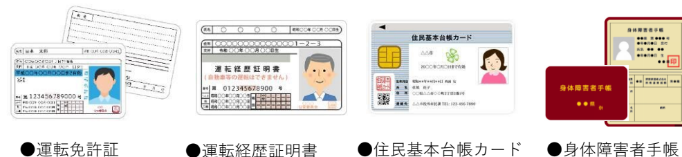
●運転免許証 ●運転経歴証明書 ●住民基本台帳カード ●身体障害者手帳