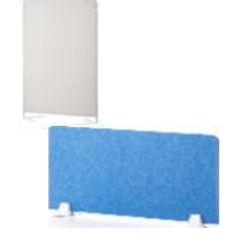
各種パーテーション