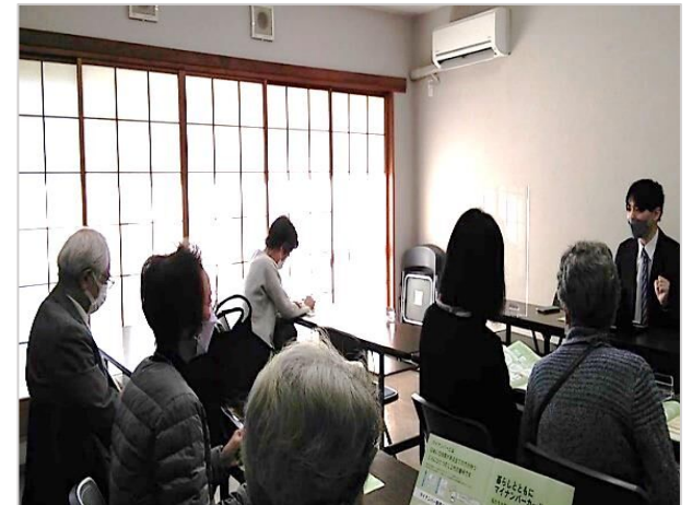
実際の講習会実施風景（1講演30分程度）