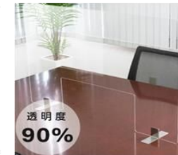
飛沫防止パーテーション