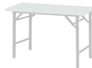
折りたたみテーブル