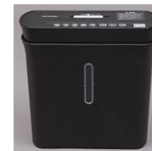
小型シュレッダー