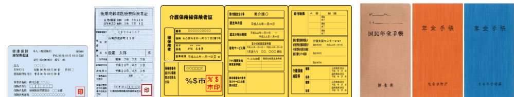
●健康保険証 ●介護保険証 ●年金手帳