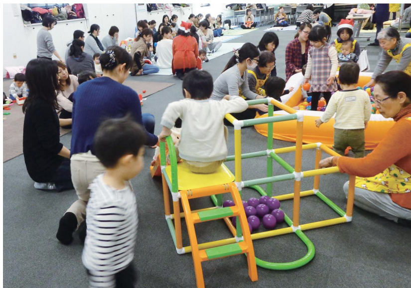
▲ふれあい子育てサロン 子育て中の親子が集まる交流の場です

みなさまからお寄せいただいた会費は、福祉のまちづくりの貴重な財源として活用させていただきます。