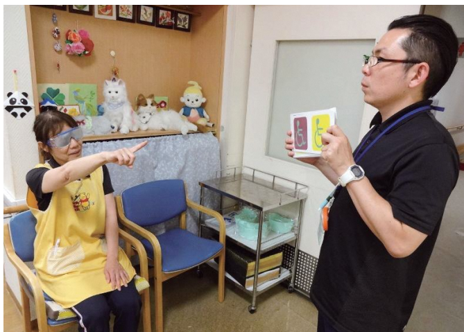
▲グラス(めがね)を装着することで、視力が弱くなったり、視界が狭くなったりした状態を体験することができます。

ご寄附いただきました福祉機器は、福祉教育・ボランティア学習を支援するため、学校や団体等へ貸出しをしています。