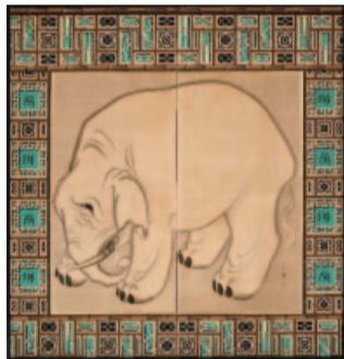
森一鳳《象図屏風》千葉市美術館蔵