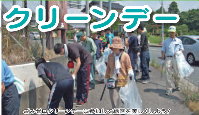
ごみゼロクリーダーに参加して緑区を美しくしよう!

申込先・問い合わせ 緑区地域振興課くらし安心室 ☎292-8106 0292-8159