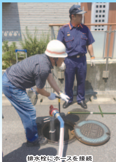
排水栓にホースを接続