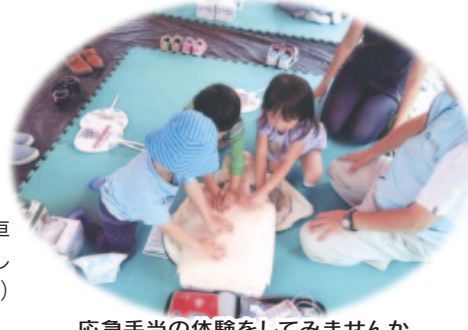
応急手当の体験をしてみませんか

問い合わせ 花見川消防署消防課 ☎259-2544 0259-2946 shobo.HAF@city.chiba.lg.jp