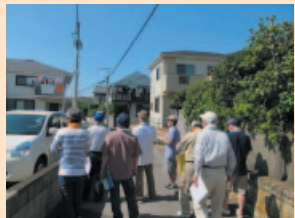
現地調査 (まち歩き)

中央区では、アドバイザーの派遣や防災マップの印刷を行い、防災マップを作成する町内自治会や自主防災組織を支援しています。