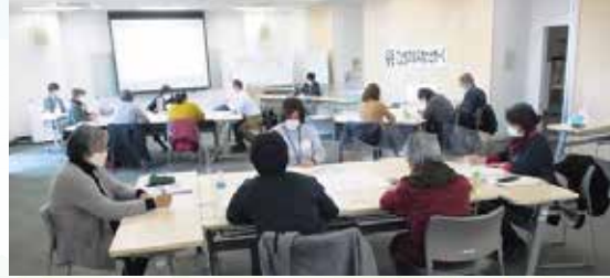
過去の学習会開催時の様子

活動目的 稲毛区内の子ども活動・子育て支援に関わる個人・団体とつながり、密接に連携して、地域力を活かした子育てしやすい環境づくりを目指します。 主な活動場所 稲毛保健福祉センター3階ボランティア活動室 主な活動内容 ウィズコロナ、アフターコロナという新たな状況の中で子育て活動団体の交流の場として、月1回のこどものWA交流会や、学習会・意見交換の場として、いなげ子育てフォーラムを開催します。