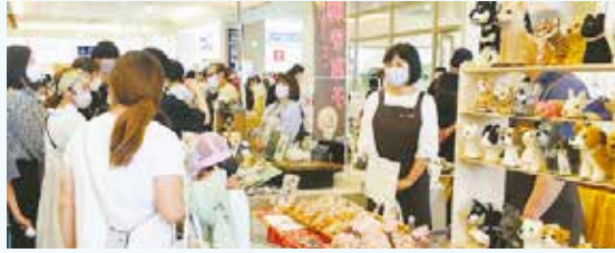
ウェルフェアマルシェ開催時の様子(2022年9月)

活動目的 人と人が出会う場を作り、市民・NPO・企業・行政が連携しながらまちを元気にする活動に取り組んでいます。 主な活動場所 まちスポ稲毛(フレスポ稲毛内) 主な活動内容 福祉作業所が制作した商品を知り、繋がりを持てる場として、秋にウェルフェアマルシェ(福祉販売会)を開催予定です。ウェルフェアマルシェを通じて「共生社会」を目指します。