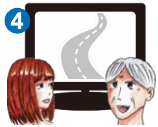
4 解決した課題を公開