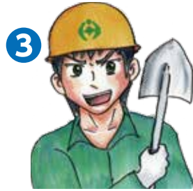
3 市役所が課題を解決（内容によって市民と力を合わせて解決）