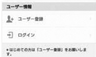
アプリを開きマイページ 「ユーザー登録」を選択