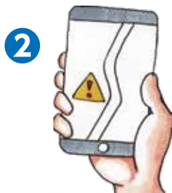
2 スマホで画像・位置情報を送信