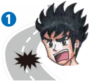
1 まちの課題を発見