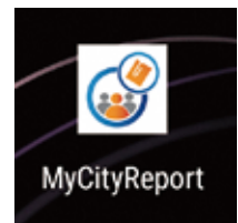
レポートする際は 「MyCityReport」の アプリを起動