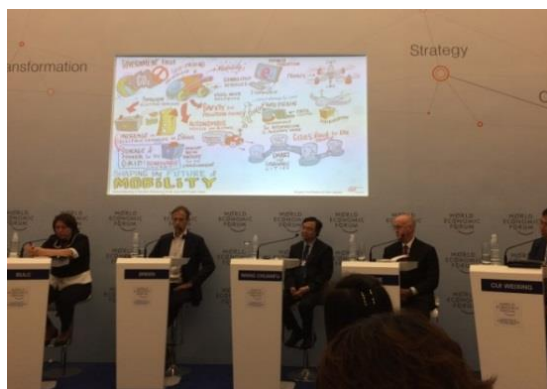
セッションの様子

組織的な変化や戦略の変更、そして新しい技術は、モビリティの将来をどのように変化させるかをテーマに議論が行われた。