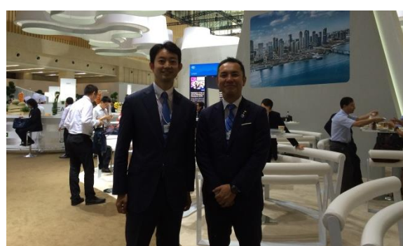
会場にて鈴木英敬・三重県知事と