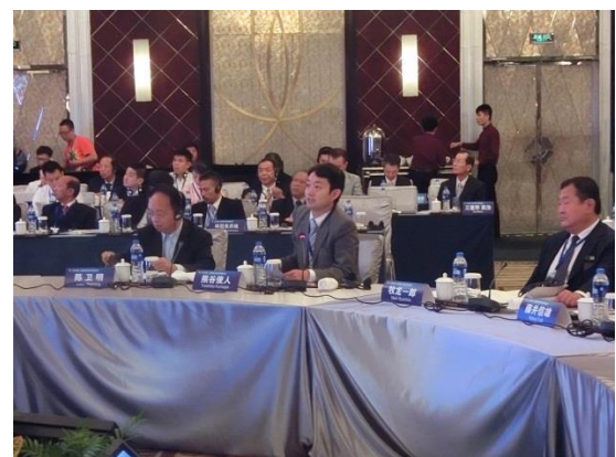
説明を行う熊谷俊人・千葉市長