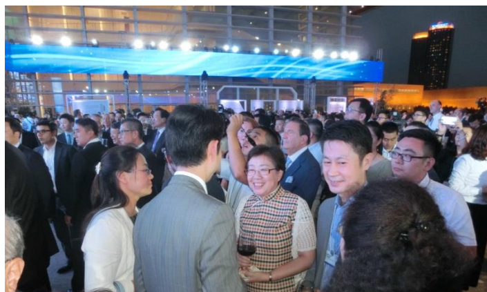
曹小紅・天津市副市長（中央の女性）と歓談する熊谷俊人・千葉市長

曹小紅・天津市副市長は、平成 27 年 9 月 9 日に、公式訪問団の代表として千葉市長を表敬訪問している。医療、教育、スポーツ分野の担当副市長であり、訪問時には、千葉市消防局指令センターや医療制度についての視察を行っている。