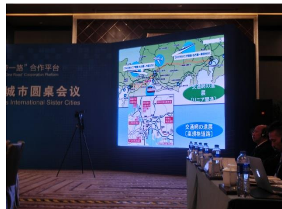
四日市市の説明映像（2）