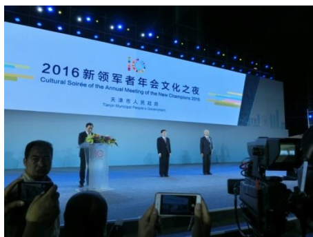
文化的イベントの開幕式