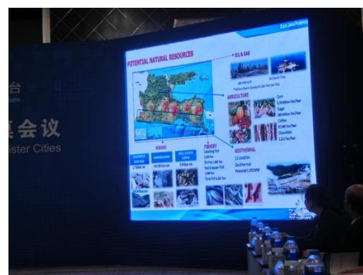
東ジャワ州の説明映像（2）