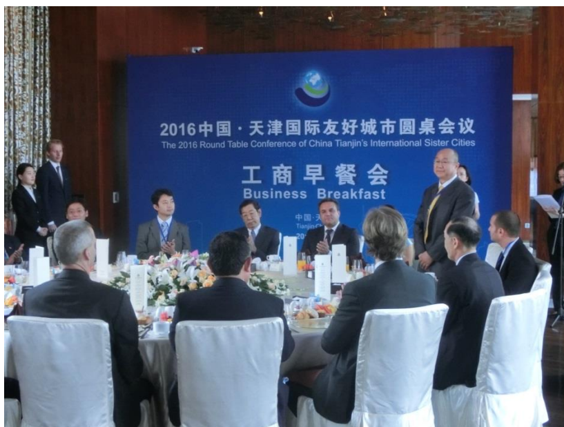
挨拶をする各都市代表