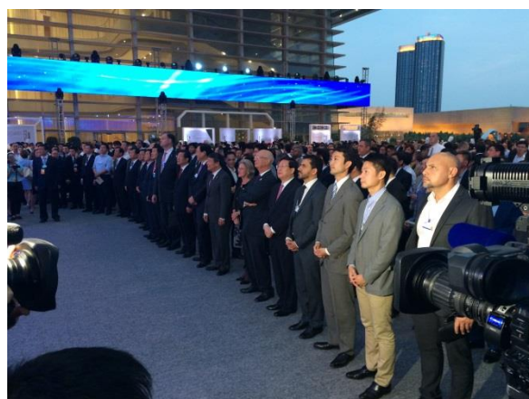
クラウス・シュワブ代表の挨拶を聴く参加者