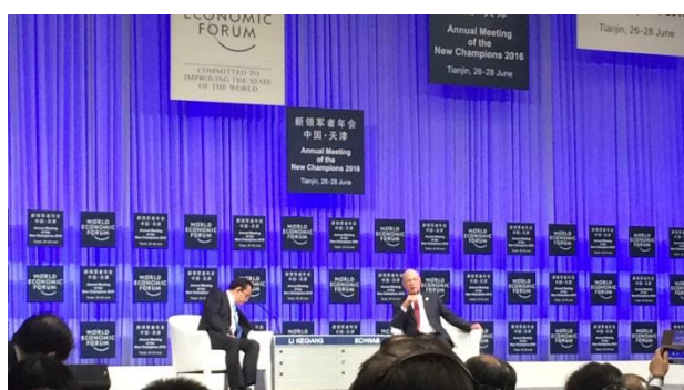
開幕式で中国経済に対する質問に答える李克強首相（左側）