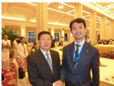
黄興国・天津市長とともに