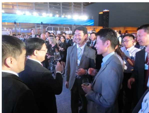
黄興国・天津市長より挨拶を受ける熊谷俊人・千葉市長