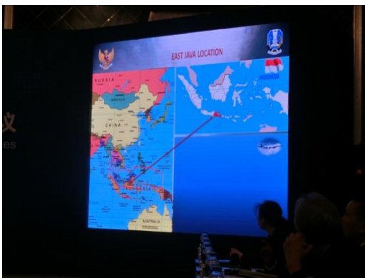
東ジャワ州の説明映像（1）