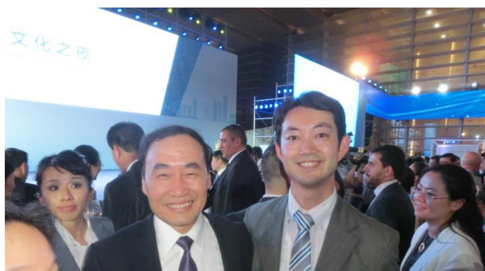
趙海山・天津市副市長と熊谷俊人・千葉市長

なお、曹小紅・副市長は、千葉大学大学院に留学経験があり、通算 10 年間も日本に住んでいた経験があることから、日本語が非常に堪能である。