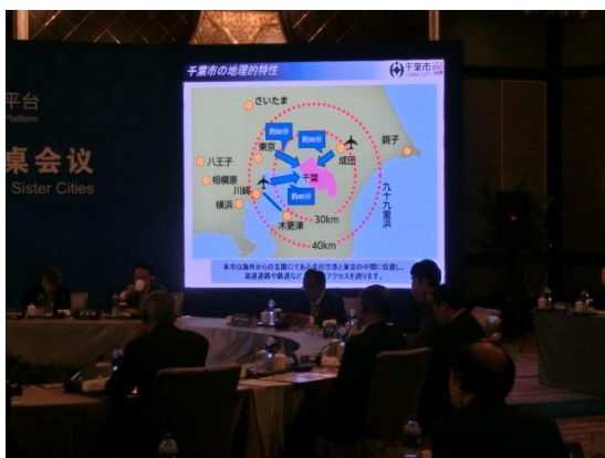
市勢概要についての説明映像