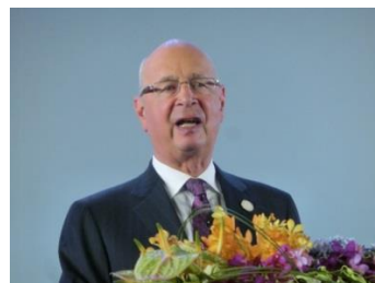
クラウス・シュワブ代表