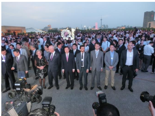
文化的イベント開催前の参加者の様子