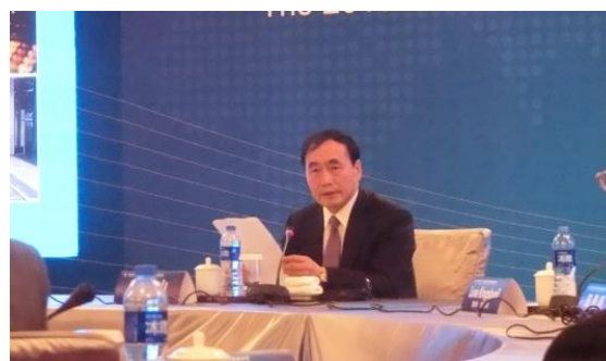
趙海山・天津市副市長