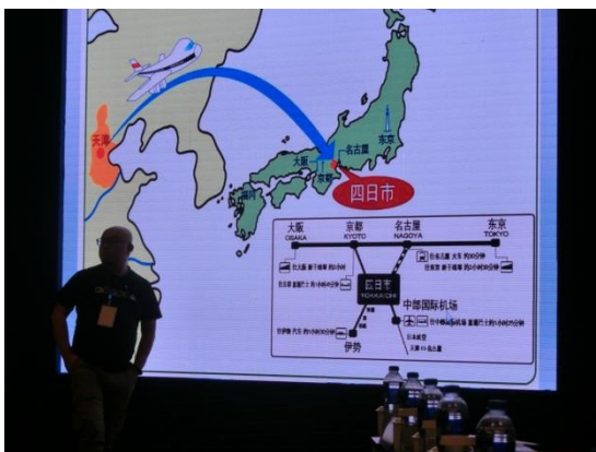
四日市市の説明映像（1）