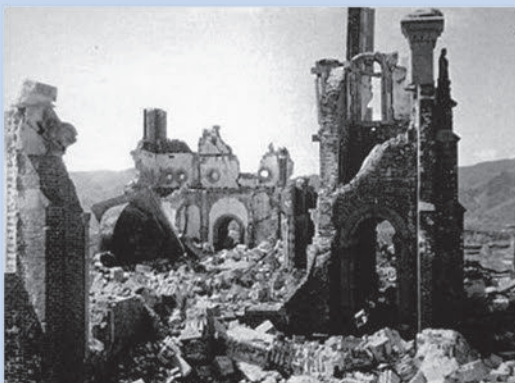
浦上天主堂 30年以上の歳月をかけて大正14年(1925年)に完成した、赤レンガ造りの天主堂は、原爆の爆風で粉々に壊れてしまいました。