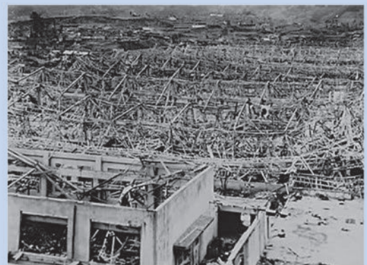
三菱兵器製作所大橋工場 工場は鉄骨に鉄板を張って作られていましたが、爆風で鉄板は粉々に飛び散り、鉄骨は折れ曲がり、工場は倒れました。