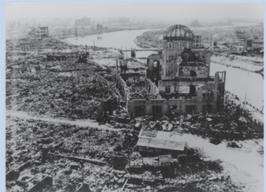
原爆投下後の変わり果てた姿 被爆時建物内の職員は全員即死でした。