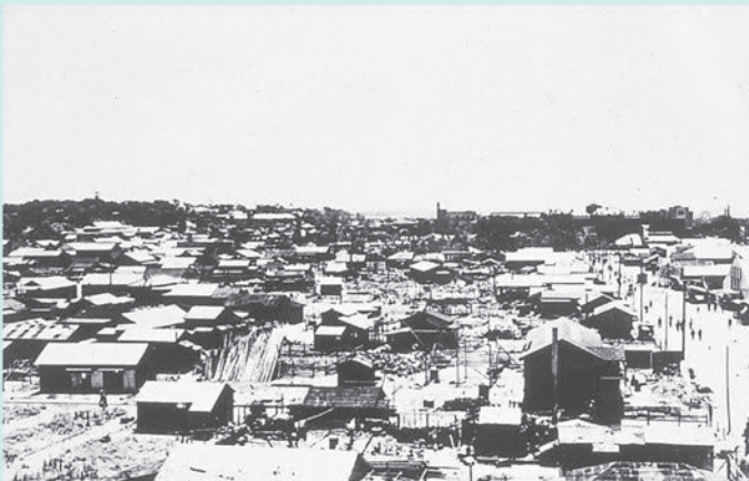
吾妻町付近(現在の中央区中央) 千葉銀行本店屋上から見た亥鼻山・県庁方面。(昭和21年〔1946年〕8月)