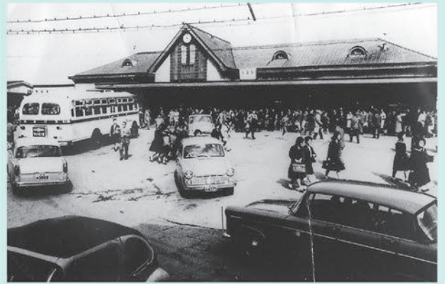
国鉄千葉駅 昭和2年(1927年)に改築された旧千葉駅。(現在の市民会館付近)