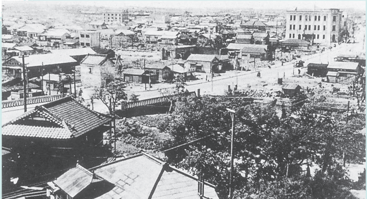
本町通り 亥鼻山から見た市中心街。中央が本町通り及び大和橋。(昭和21年〔1946年〕8月)