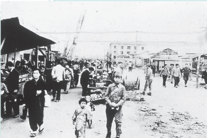
千葉銀座通りのヤミ市 昭和21年(1946年)秋頃のヤミ市の様子。正面が千葉銀行本店です。