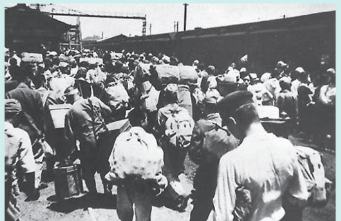
国鉄千葉駅前の買い出し部隊 主な生活物資は配給制でしたが、ヤミ市はますます増加していきました。