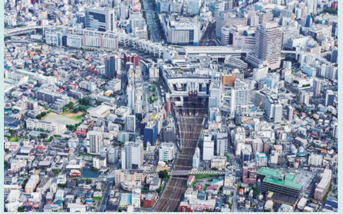
JR千葉駅(令和3年(2021年)9月)