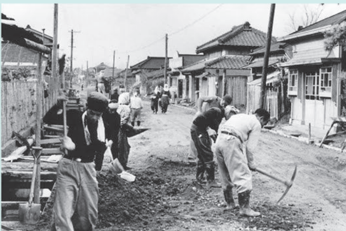
勤労奉仕 昭和22年(1947年)頃、浜野町付近。近隣の人々が協力しあい、道路工事を行いました。