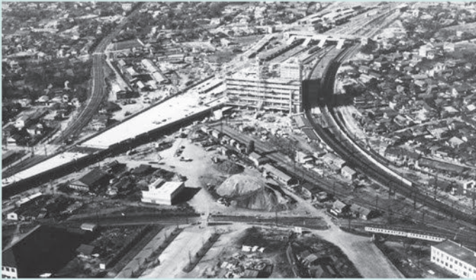
移転工事中の国鉄千葉駅 昭和38年(1963年)4月28日に開業しました。