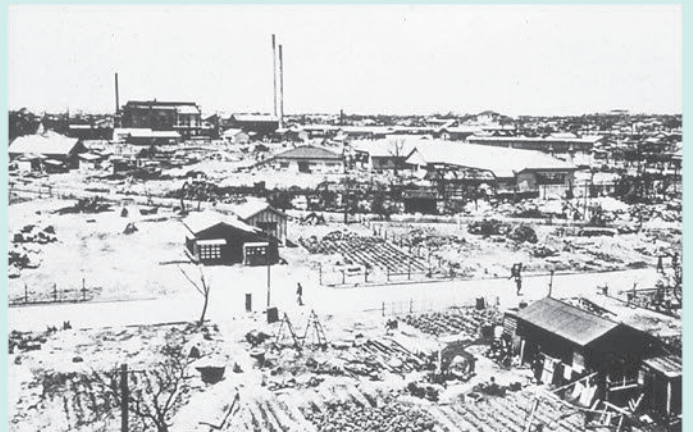
本千葉町方面(現在の京成千葉中央駅付近) 県教育会館屋上から見た本千葉方面。煙突は旧参松。(昭和21年〔1946年〕8月)