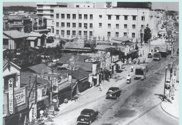
昭和30年代の旧京成千葉駅跡