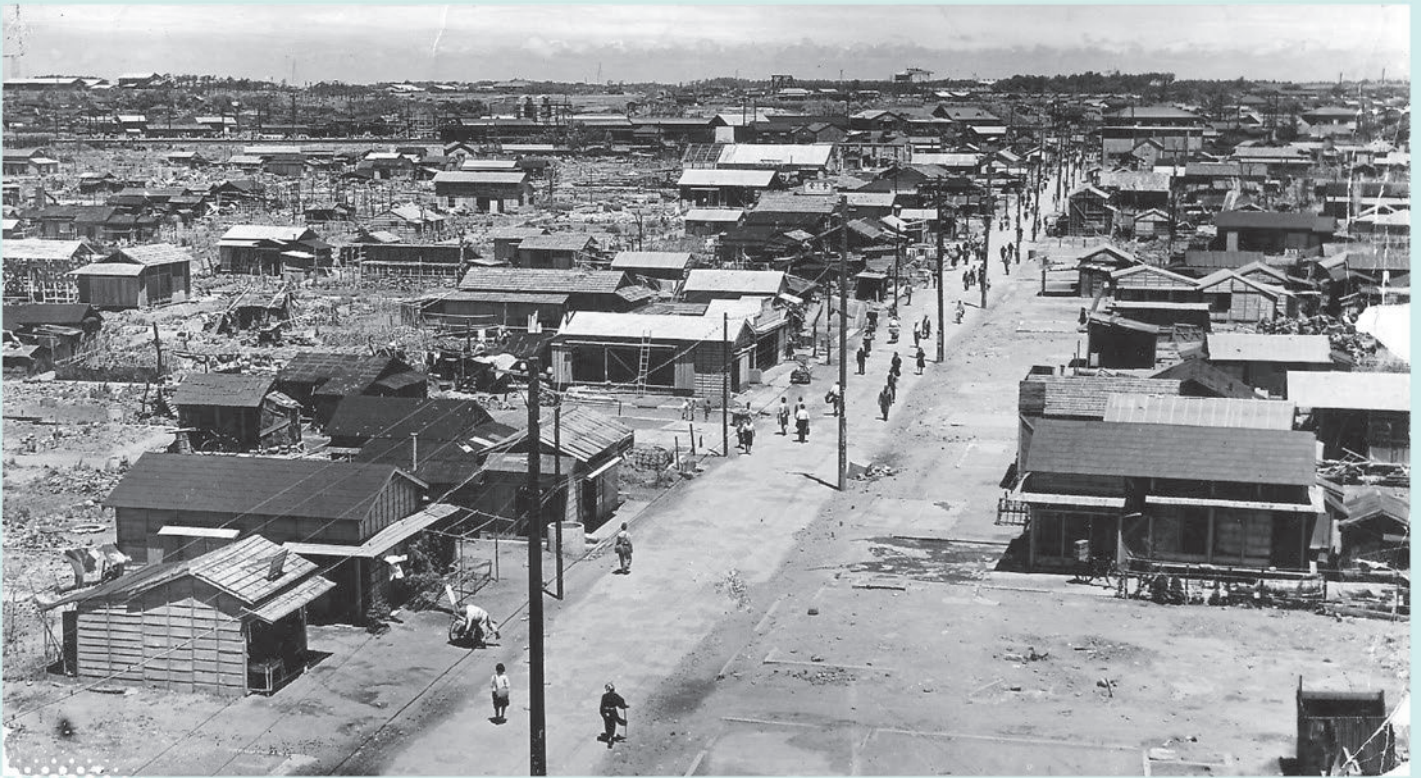
栄町通り 千葉銀行本店屋上から見た栄町通り。通りの正面は国鉄千葉駅。(昭和21年〔1946年〕8月)