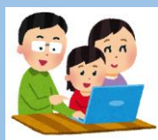
WEB講習証明書を印刷

この程、自宅などでe-ラーニングを受講し消防局で開催する90分の短時間救命講習を受講することで、普通救命講習(講習時間：3時間)と同じ修了証を交付いたします。