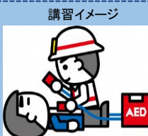
90分の短時間救命講習