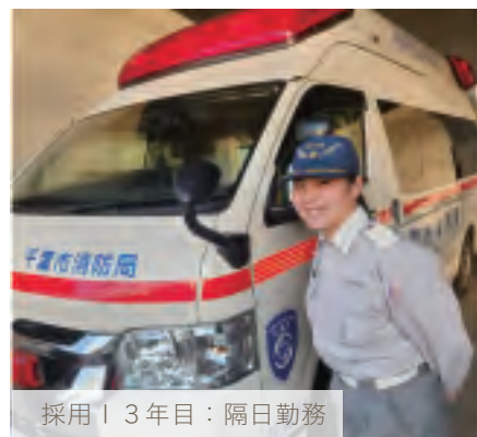
採用13年目：隔日勤務

消防士は、助けを必要としている所にいち早く駆け付け、市民に寄り添うことができる仕事だと思います。しかし、男性職員が多く、女性は働き辛そうで、何ができるのかと不安な気持ちで消防士になりました。救急隊として従事していく中で、患者さんや関係者に「女性がいて安心した。ありがとう。」と言ってもらった時に、私も消防士として勤務してよかったと、やりがいを感じるようになりました。皆さんと一緒に働ける日を楽しみにしています。