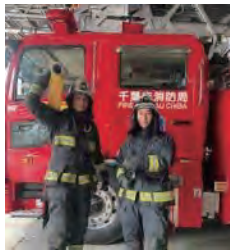
アドバイザー 平成26年度採用