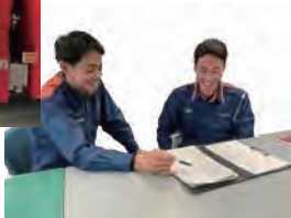
新任職員 令和5年度採用

新任職員 消防学校卒業後から在職期間が3年になるまでの職員 アドバイザー職員 勤続5年以上の消防士、もしくは消防士長、消防司令補