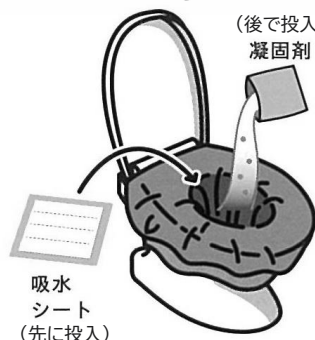
イラスト:日本トイレ研究所