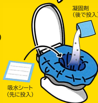
イラスト:日本トイレ研究所