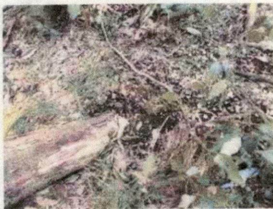
倒木による貝層の露出・損壊