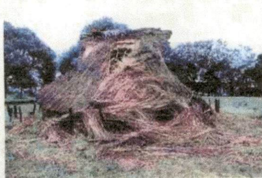
復元住居の茅葺屋根の損壊