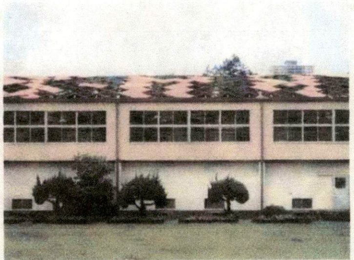
千草台東小 (倒木によるフェンス破損)