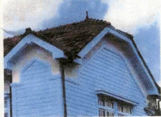
屋根瓦の落下、破損