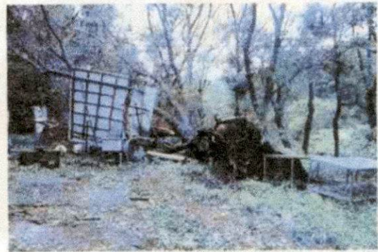
倒木による水道施設の損壊