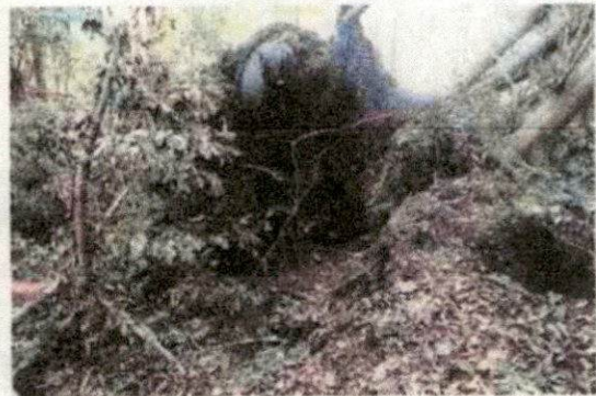
倒木による貝層の露出・損壊