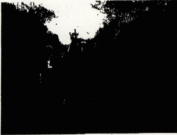
成田線成田駅～久住駅間土砂流入