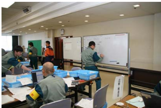
・ 情報集約班 (集計・記録など)