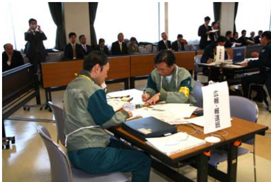
・広報・報道班（報道機関との連絡調整など）