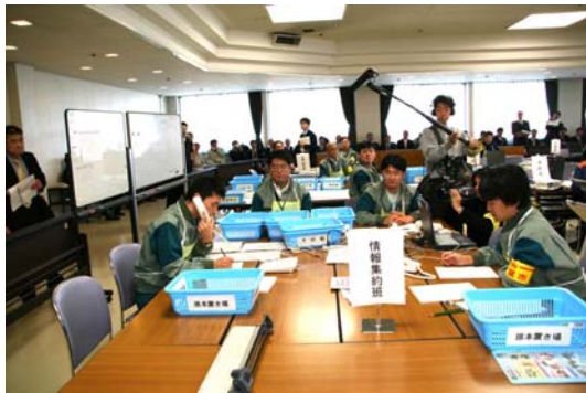
・ 情報集約班 (被害情報等の収集など)

※市緊急対処事態対策本部等の設置運営訓練については、事前に詳細な訓練シナリオを提示しない、いわゆる「ブラインド式」を一部採り入れて実施した。