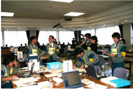
・統括班（各局対策部との調整、対応協議）