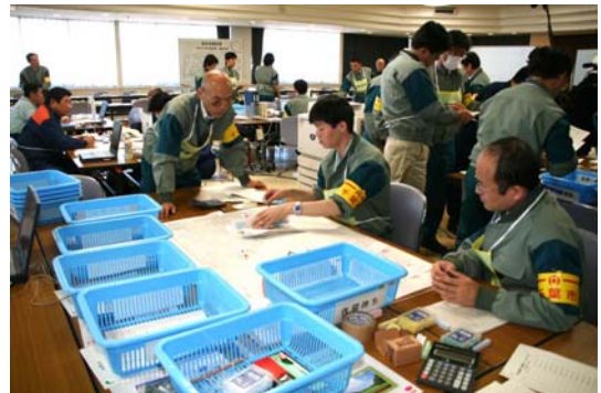
・ 情報集約班 (集計、作図など)