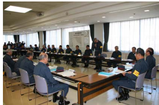
・本部員会議全体風景