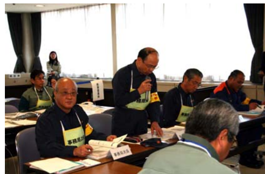
・林事務局長より避難実施要領について説明