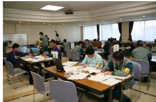
・各局本部連絡員（所管・本部間との連絡調整など）