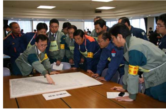
・統括班（臨時会議を召集、全体で対応を協議）