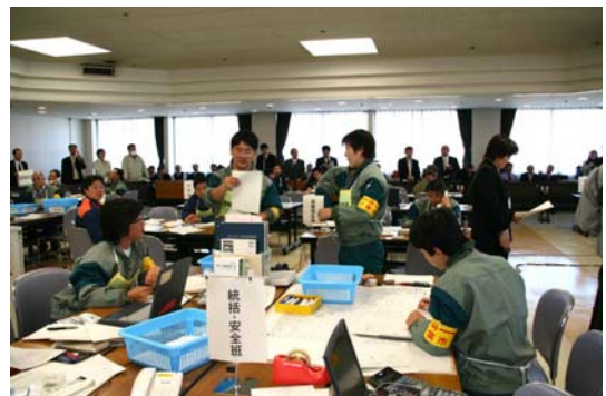
・ 統括班 (被害情報等を確認し対応を検討)