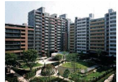
幕張ベイタウンの概観