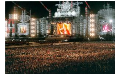
幕張メッセでの音楽イベントの様子