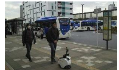
自律走行ロボットの走行実証の様子