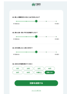
ユーザーアンケート