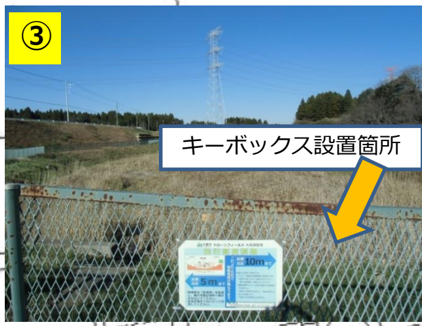
キーボックス設置箇所