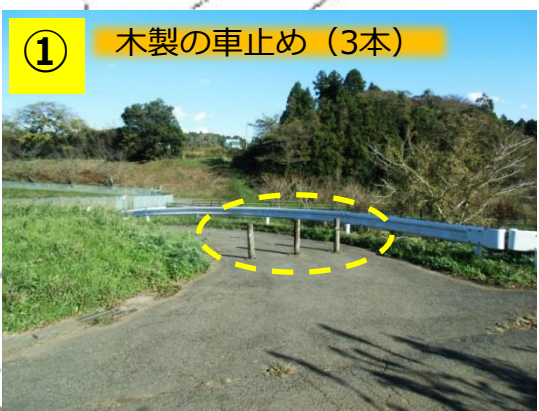
① 木製の車止め (3本)