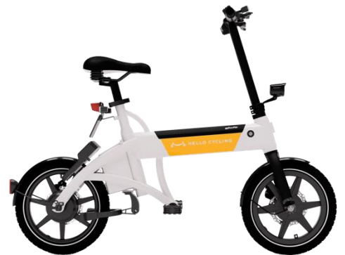
使用車両イメージ