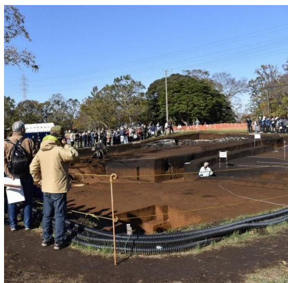
昨年度の現地説明会の様子