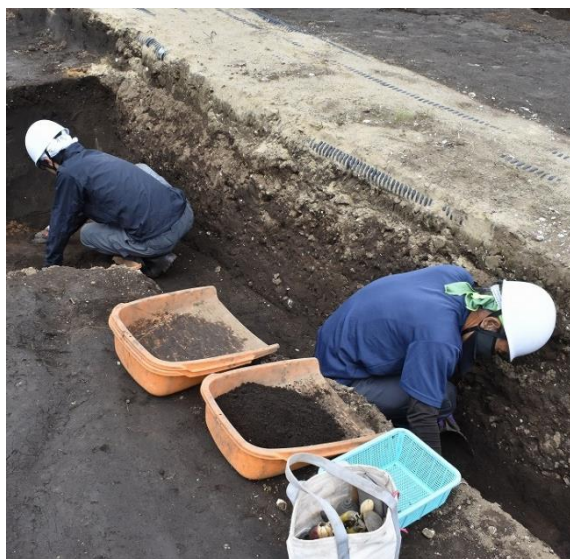
今年度の発掘調査の様子