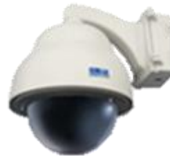
カメラ外観イメージ