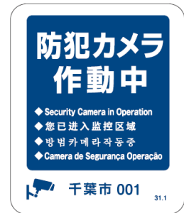
プレート・ステッカー