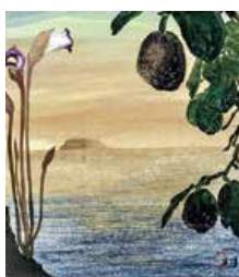
《奄美の海》昭和50年(1975) 個人蔵※