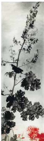
《彼岸花》昭和前期 川村コレクション※