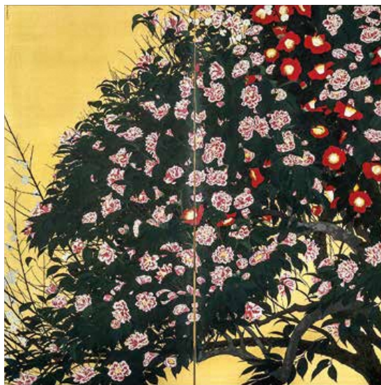
《椿図屏風》昭和6年(1931) 千葉市美術館蔵