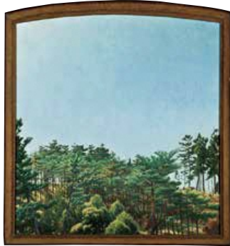
《仁戸名蒼天》昭和35年(1960) 個人蔵※