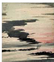
《夕日》昭和10年代 千葉市美術館蔵 (川村コレクション)