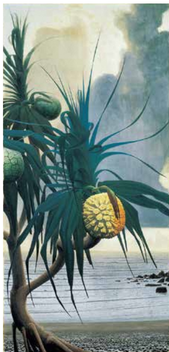
《アダンの海辺》昭和44年(1969) 個人蔵※

10 years have passed since the Tanaka Isson Exhibition that caused a great sensation by creating a “wholly new view” through fundamental inquiry. Through the roughly 100-strong entire collection of works that has subsequently been housed in the Chiba City Museum of Art, we will go in search of yet unknown aspects from the painter’s lifework.